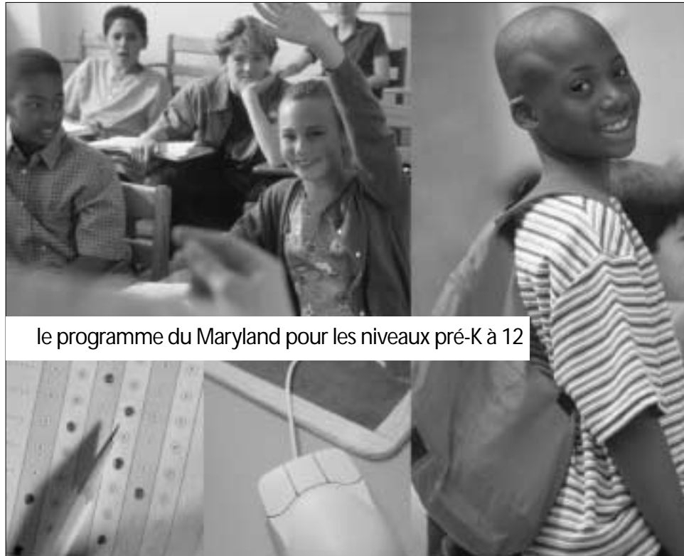
le programme du Maryland pour les niveaux pré-K à 12