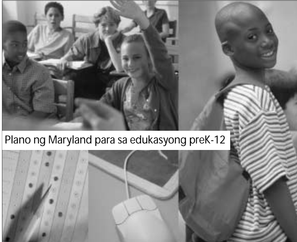
Plano ng Maryland para sa edukasyong preK-12