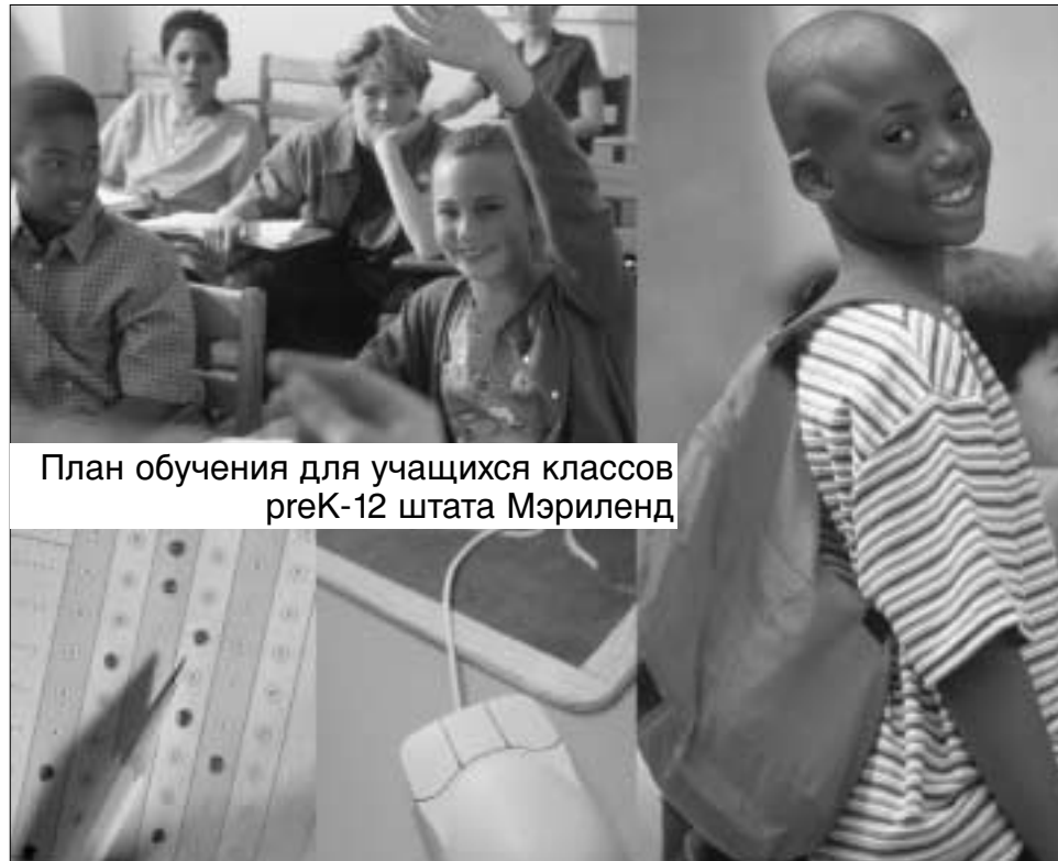
План обучения для учащихся классов preK-12 штата Мэриленд